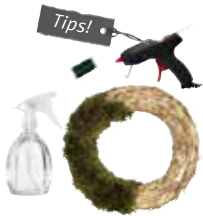
Materials for the wreath on the front

NL Een krans aan de deur, in het raam of op de tafel verhoogt de kerstfeer. Hier laten we je een paar eenvoudige ideeën zien voor het versieren van de kransen. Tip! Als het mos droog is, kun je er water op sprayen. Verdeel het mos over de krans en bind het vast met bloemendraad. Bevestig de versiering met een lijpistool.