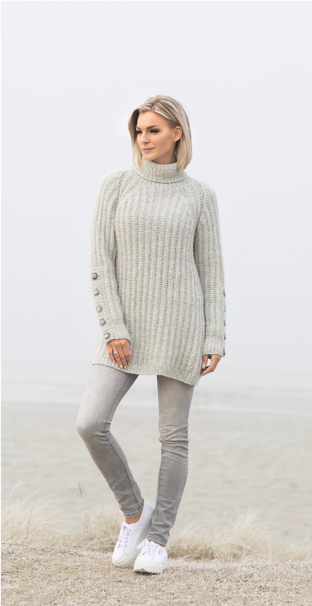
Design: Turid Stapnes