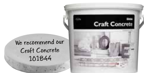
Pack of 3,5 kg.