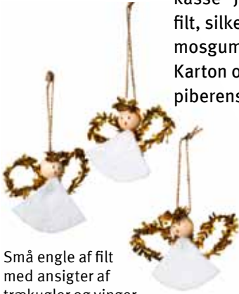
Små engle af filt med ansigter af trækugler og vinger af piberensere.

Karton og glansbilleder limes fast med limstift og pailletter og piberensere med Panokitt lim Quick.