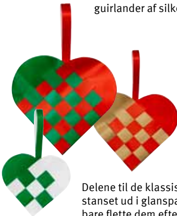
Delene til de klassiske hjerter er stanset ud i glanspapir, så du skal bare flette dem efter vejledningen.

De søde nissepiger er lavet af glitter-mosgummi, og håret er af garn. Hæng et eller flere hoveder på døren, så meddeler bjælderne, når der kommer nogen ind!