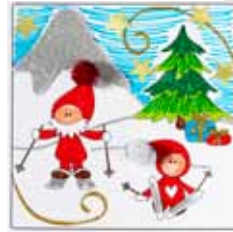
Mal julekortene med tusser efter de fortrykte streger. Dekorér med pomponer, stjerner, glitterlim m. m.