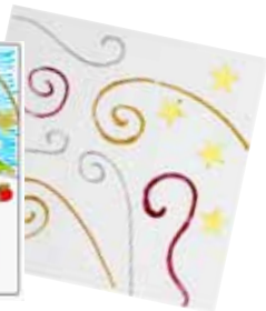
Fargelegg julekortene med tusjer etter de fortrykte linjene. Dekorér med pomponger, stjerner, glitterlim m.m.