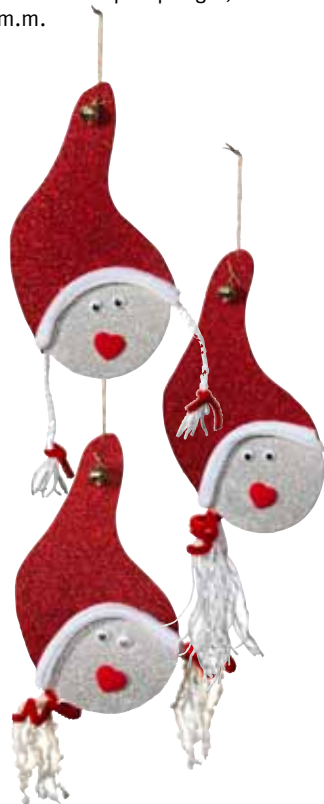
De søte nissejentene er laget av glitrende mosegummi og har fått hår av garn. Heng et eller flere hoder på døren så plinger bjella i luen hver gang noen kommer.