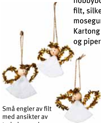
Små engler av felt med ansikter av trekuler og vinger av piperensere.

Alle materialene som vi har brukt her finner du i Panduros hobbyboks "Jul" en smart boks fylt med glitterlim, paljetter, filt, silkepapir, saks, glansbilder, kartong i ulike farger, mosegummi, lim, julekort til å fargelegge, tusjer m m. Kartong og glansbilder limes fast med limstift, paljetter og piperensere med Panokitt lim Quick.