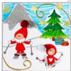
Måla julkorten med fiberspetspennor efter de förtryckta linjerna. Dekorera med garnbollar, stjärnor, glitterlim m m.