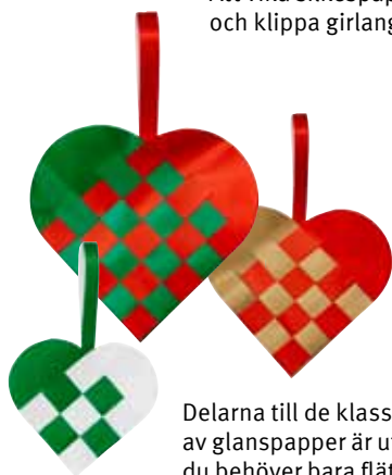
Delarna till de klassiska hjärtana av glanspapper är utstansade, så du behöver bara fläta dem efter beskrivningen.

De söta tomteflickorna är gjorda av glittrigt dekorgummi och har fått hår av garn. Häng ett eller flera huvud på dörren så plingar bjällran i mössan när någon kommer in.