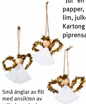
Små änglar av filt med ansikten av träkulor och vingar av piprensare.

Kartong och bokmärken limmas fast med limstift, paljetter och piprensare med Panokitt lim Quick.