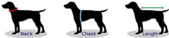
Kaulanymp. Rinnanymp. Selän pituus

OTA KOIRASTA MITAT SEURAAVISTA KOHDISTA: HUOM! Rinnanympärys on olennaisin mitta sopivan koon valinnassa.